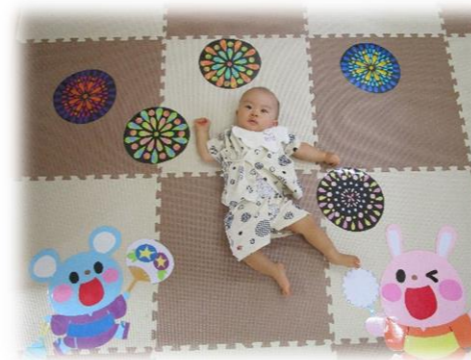
寝相アート はい！ちーず★